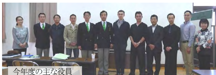
今年度の主な役員

4月23日(日)塩尻市広丘公民館で平成29年度通常総会が開かれました。会長、役員交代ほか、今年度の県連盟の方針が確認されました。