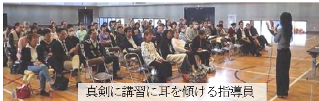
真剣に講習に耳を傾ける指導員