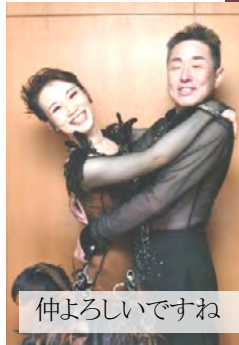
仲よろしいですね

こんにちは！飯山市の高橋組です。罪ほろぼしと思って（何の？）一緒にダンスをなさいと妻に言われ、しぶしぶ始めて早 20 年過ぎました。お陰様で今年 JDSF スタンダード A 級に昇級できました。20 年の間には、胃がん、腎臓がんを患い、入院、手術と大変なこともありましたが、なんとか生き長らえています。妻には世話になりっぱなしですので、少しでも上達し、楽しんでもらえるよう努力して行きたいと思っています。