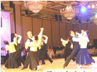
フォーメーション

今年はじめの 1 月 8 日(日)松本市ホテルブエナビスタで普及部主催のダンススポーツアワード 2017 が開催されました。会員拡大を目的に、ワンランク上のダンスシーンを提供しました。永年功労者の表彰、トライアル、グループ発表、ソロデモ、支部対抗戦、ドレスショーなどがあり、盛り沢山のイベントでした。