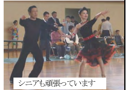
シニアも頑張っています