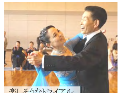
楽しそうなトライアル

3 月 21 日(土) 須坂市北部体育館で第 2 回ダンススポーツフェスティバル in 北信が開催されました。トライアル(ラテン:ルンバ、チャチャチャ、サンバ、スタンダード:ワルツ、タンゴ、スロー)、グループ発表、交流会が行われました。参加された皆さんは終日ダンスを楽しみました。