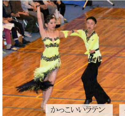
カッコいいラテン

保育園年長組の時にジュニアダンスきらりん☆スマイリーに入ったのがダンスを始めるきっかけでした。小学校2年生での佐久大会が初出場で、結果は小学生以下戦ラテンは1次予選落ち。メレンゲ・サルサ4位が2人の結果でした。あれから6年。指導者、先輩、仲間にも恵まれ、ラテンA級、そしてスタンダードも今年A級に昇級する事ができました。また、JDSFジュニア準強化選手にも選ばれたので、もっと頑張ってお練習し、上達したいです。