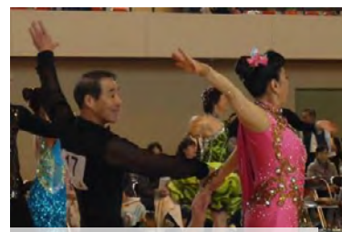
ダンスはやめられませんね