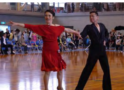
日頃の練習の成果を発揮して伸び伸び踊る出場選手

9月19日(月)須坂市北部体育館で開催された第10回竜の里須坂ダンススポーツ大会はドラゴン戦、B、C、D1、D2、1、3、シニアIII A、シニアIII D、ジュニア小学生以下、ジュニア中学生以下部門に138組がエントリーし、大勢の観客と参加選手が声援を送りおおいに盛り上がりました。