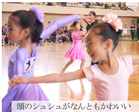
頭のシュシュがなんともかわいい

11月20日(日)佐久市総合体育館で第43回長野県ダンススポーツ大会が開催されました。近県からも大勢の選手のエントリーがあり、202組のべ382区分で競われました。今回は、ジュニアの出場がたいへん多く、明るい未来を感じました。