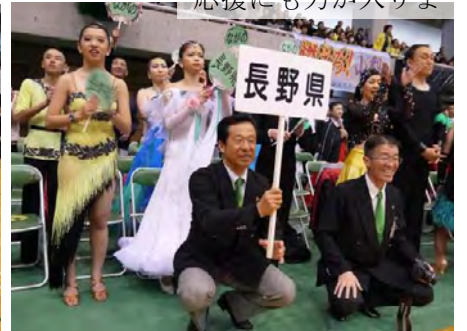
応援にも力が入りま