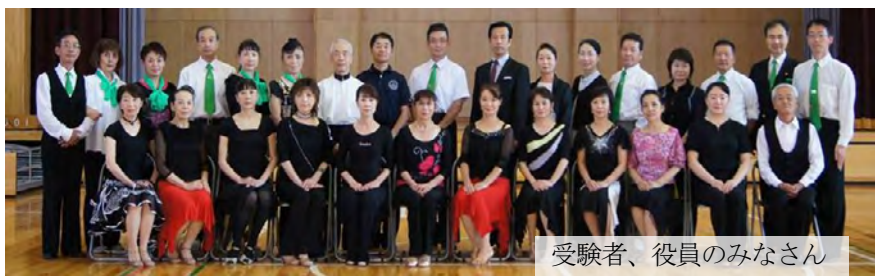
受験者、役員のみなさん

9月11日(日)塩尻市立広丘小学校体育館広丘小学校体育館で行われた認定会はグレードコース6から1(4を除く)のスタンダード(ワルツ・タンゴ)とラテン(チャチャチャ・ルンバ)、およびハイグレードコース4のスタンダード(タンゴ)、ラテン(チャチャチャ)の試験が行われました。受験者数はグレードコース13名、ハイグレードコース11名でした。広い体育館では緊張感があふれる中、空いたスペースで次の受験者が繰り返し練習している姿がみられました。みなさんお疲れ様でした。