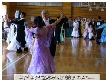
まだまだ軽やかに競えるぞー