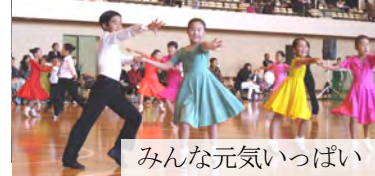
みんな元気いっぱい