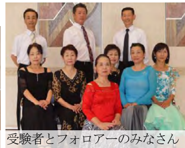
受験者とフォローのみなさん