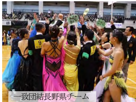
一致団結長野県チーム