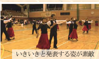
いきいきと発表する姿が素敵