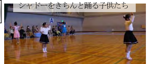
シャドーをきちんと踊る子供たち