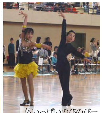
体いっぱいぴのびのびー