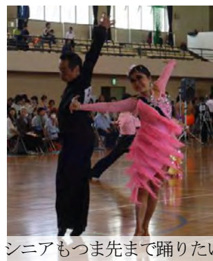
シニアもつま先まで踊りたい