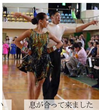
息が合ってきました