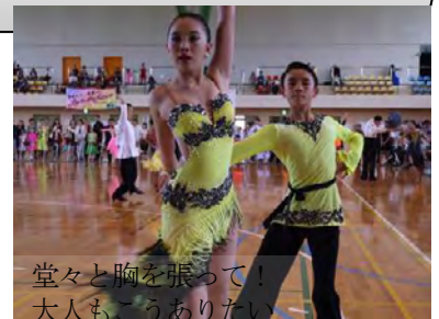
堂々と胸を張って！ 大人もこうやりたい