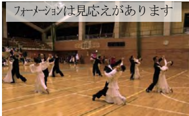
フォーメーションは見応えがあります

平成 27 年 12 月 13 日(日)伊那市市民体育館で長野県一円のダンス愛好者が集結し年末ダンススポーツフェスティバルが開催されました。サークル発表ではジュニア 4 サークル、一般 7 サークルの発表があり中南信のサークルがメインでしたが北信地区からもフォーメーションの参加がありました。トライアルにはジュニアも含めラテン 35 組、スタンダード 85 組の参加があり非常に盛り上がりました。午後からはダンスタイム、指導員紹介があり、和やかな熱気あふれるダンス交流の時間となりました。