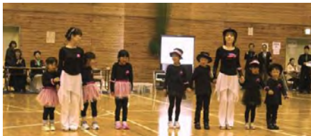
子供たちの参加に未来を感じました