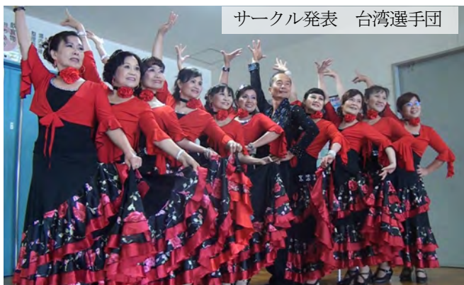
サークル発表 台湾選手団