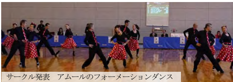
サークル発表 アムールのフォーメーションダンス

第1部サークル発表(フォーメーション、グループ演技)、第2部トライアル(1ヒート3、4組のダンス披露)、第3部普及型競技会というプログラムで行われました。