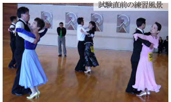
試験直前の練習風景

平成27年1月25日(日)中野市コミュニティスポーツセンター2階多目的ホールで技術認定部による第23回技術認定会が開催されました。今回の試験区分はハイグレード4で種目はラテンのルンバとチャチャチャ、スタンダードのワルツとタンゴの4種目が行われました。受験者は男子1名、女子6名の合計7名で、指導員の方とグレード6~1を合格された方々です。受験者のみなさんは事前に講習会、練習会に幾度も参加し勉強されました。使用されるアマルガメーション(足型)は難しいものや踊り慣れないものも入っており、大変努力されたことがうかがえました。後日全員の合格判定が通知されました。