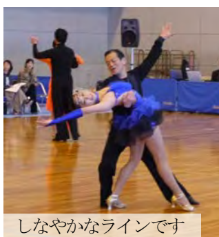
しなやかなラインです