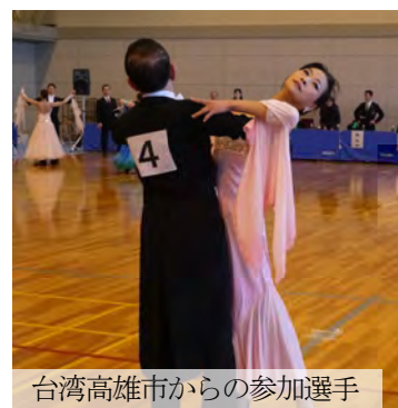
台湾高雄市からの参加選手