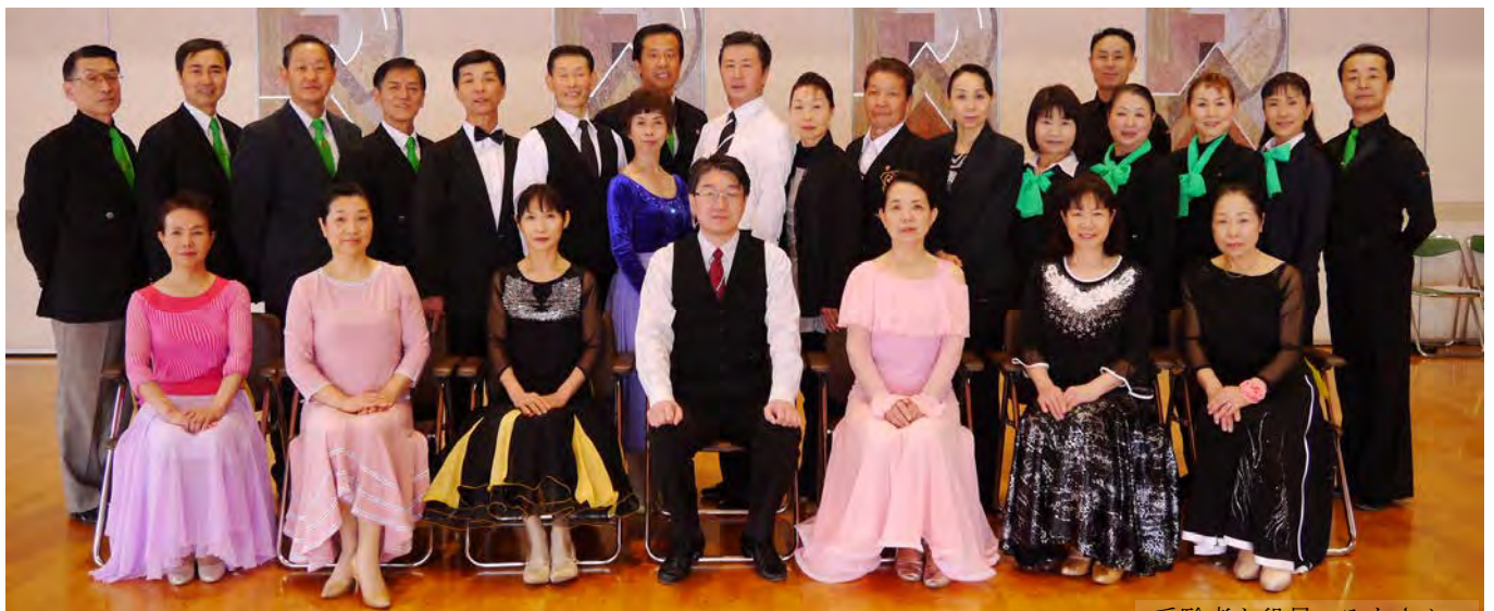
受験者と役員のみなさん