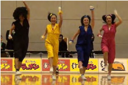
サークル発表 佐久のチームです ハツラツとしています