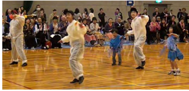
サークル“BB 団”のジャズダンスの披露