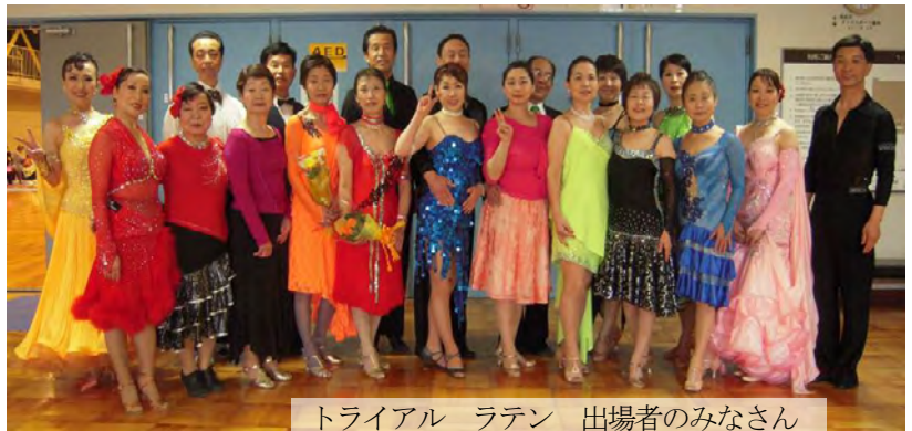
トライアル ラテン 出場者のみなさん

3月30日(日)須坂市北部体育館で第3回長野県ダンススポーツフェスティバルが開催されました。普及型競技会として開催した第1回、第2回大会を、さらに多くの方に参加してもらうよう工夫し、気軽に競技や発表の場を楽しんでもらう大会としました。大会は3部構成とし、1部はサークル発表、2部は指導者と踊るトライアル、3部は普及型競技会としました。