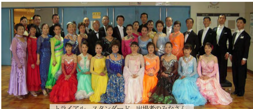
トライアル スタンダード 出場者のみなさん

ったら私も出たいとの声が聴かれました。第3部は普及型競技会が行われました。出場区分もカップルで125歳以上、60歳以上の女性同志など競技ダンスを楽しんでもらう趣旨で様々な区分が設定されました。