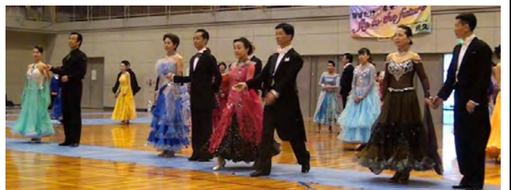
トライアル アナウンスの呼び出しで入場する時です。 緊張しますね。