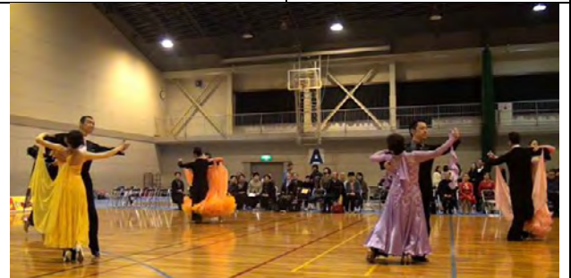
フォローリーダーさんがしっかりしているので 安心ですね