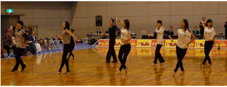
北信のジュニアチームの躍動感あふれるダンスです