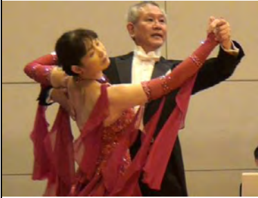
練習を十分積んだ様子がかげえます