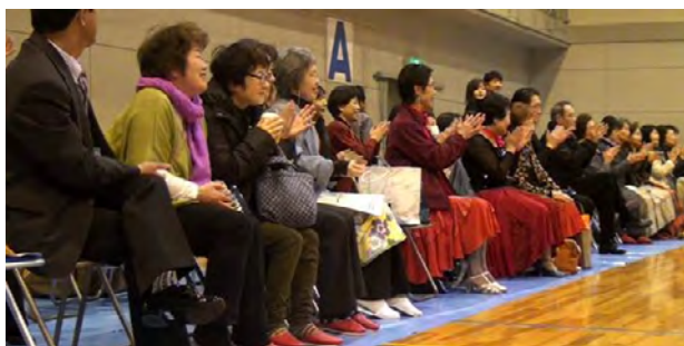
観客の皆さんの応援にも熱がはいります