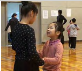
おねえちゃん楽しくやろうね