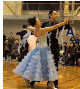
トライアルのひとつコマ