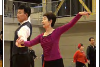
本番前の練習 本番も伸び伸び踊れる といいね