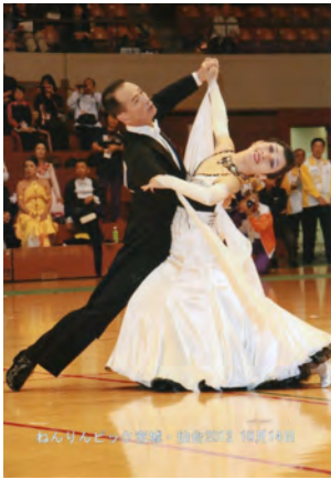
ねんりんピック 2011年9月23日