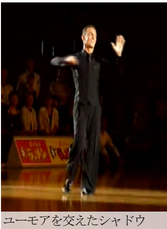
ユーモアを交えたシャドウでのワンポイント講習