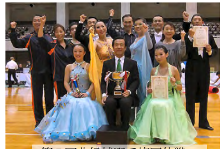
第7回北信越選手権団体戦 優勝 4連覇の長野県チーム

あとがき デレビの健康番組で腰痛、膝痛、内臓疾患などの予防に必要なことは運動だという。しかも、心の持ち方から全身運動すべてがダンスに結びつく。ダンスを愛するみなさん!!ダンスほど健康に良いことはないのです。ダンスをされていて良かったですね。