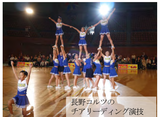
長野コルツのチアリーディング演技