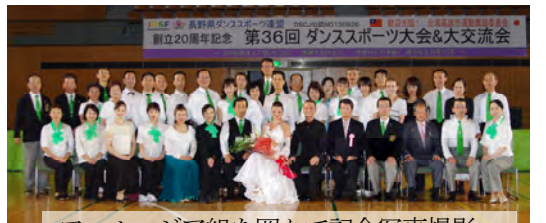
フェルージャ組を囲んで記念写真撮影