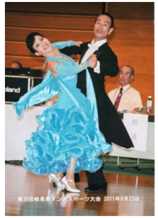
第35回岐阜県ダンススポーツ大会 2011年9月23日

定年後の趣味にとダンスサークルに入会したのは平成14年、リーダー54歳のときでした。指導者が競技選手だったこともありサークル仲間と競技を始め、平成16年JDSF5級戦のデビュー、指導者ご夫婦の指導のおかげで平成19年A級に昇級することができ、現在JDSFとJBDF中部でスタンダードA級として競技を続けています。4年前飯田市に転居しサークル“ウイング”の仲間と練習しており、長野県代表として出場した一昨年の仙台ねんりんピックではワルツ、タンゴともに4位に入賞することができました。これからも健康に気をつけ長く競技が続けられたらと思っています。