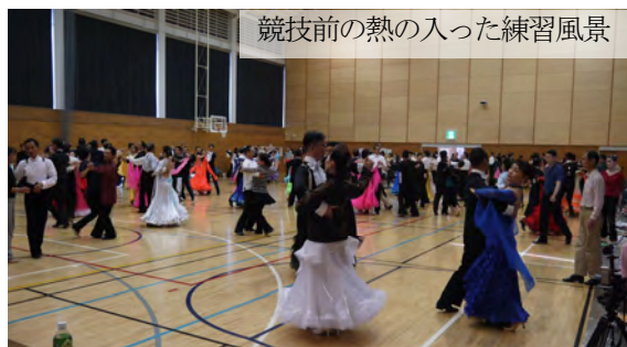
競技前の熱の入った練習風景

11月3日(日)小布施町文化体育館で第37回長野県ダンススポーツ大会が開催されました。A級〜3級まで157組の選手が日ごろの練習の成果を発揮し、熱戦を繰り広げました。小布施町体協創立40周年にあたり小布施町長杯としてクリスタルの盾がA級スタンダードに、小布施町教育長杯がB級ラテンの優勝者に贈られました。