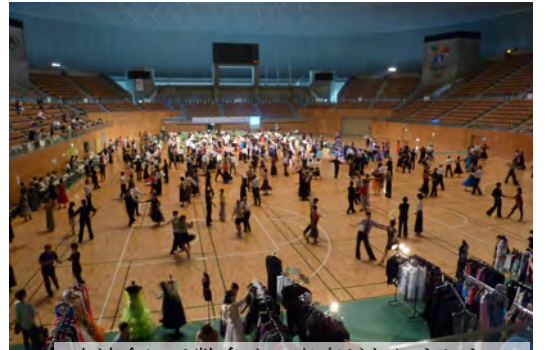
交流会には数多くの出店がありました

メインイベントとしてWDSFプロフェショナル部門へ転向したばかりの特別ゲストのベネデット・フェルージャ組のデモンストレーションがありました。確かな技術に裏打ちされた力強いデモは見応えがあり圧巻でした。ベネデットはシャドウダンスを披露したり、ワンポイントレッスンしたり、他では見られないサービスをしてくれました。