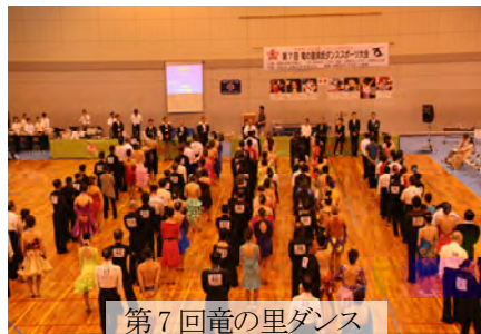
第7回竜の里ダンス スポーツ大会開会式