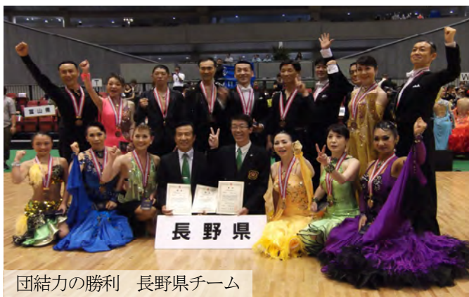
団結力の勝利 長野県チーム