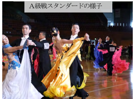
A級戦スタンダードの様子