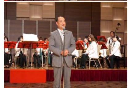
衆議院議員 木内均様の祝辞