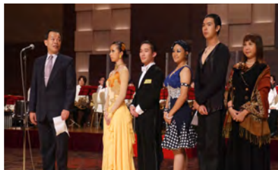
台湾高雄市からの選手団