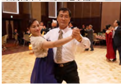
和気あいあいとダンスタイム