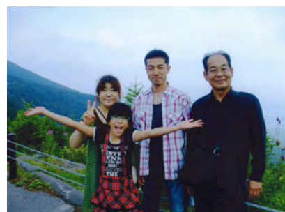
左から 長女(貴子) 孫(玲愛) 婿 爺 標高2000メートルの高峰高原にて

東信支部長の関文夫です。私がダンスを始めた頃かかる音楽の種目はジルバ・ブルース・マンボでした。今だと考えられないですね。ルンバの曲が流れても踊るのはBOXルンバ。時は流れてヴェニーズワルツまで踊れるパーティーが増え時代の流れに置いて行かれそうな63歳の2人の孫の爺です。ダンス？ダンスは楽しいのが一番じゃないでしょうか！特に女性に気持ち良かった！と言ってもらえたら男冥利に尽きますね。