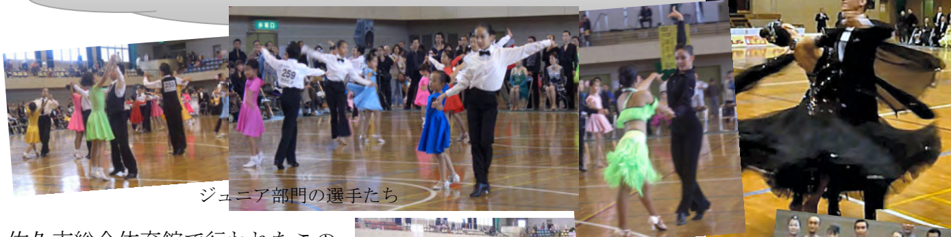
ジュニア部門の選手たち

佐久市総合体育館で行われたこの大会はA級戦のほかワルツとチャチャチャの2種目で競われるプレジュニア総合などの区分を設定し実施されました。