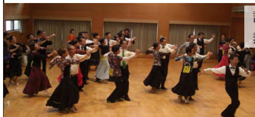
試験前の練習にも熱が入ります

10月23日(日)長野市稲里地区センター(北)で、技術認定会グレード2が実施されました。県下全域よりグレード3終了者32名が受験しました。グレード2から審査基準が、グレード3~6よりも厳しくなるということで、受験者も実行役員も緊張感あふれる中での認定会となりました。グレード3から6までの認定会及び講習会は各支部ごとに積極的に実施されました。