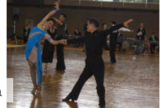
伸びのびしてますね