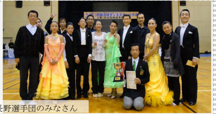
長野選手団のみなさん

10月30日(日)開催された第5回北信越選手権でA級戦、グランドシニアA級戦、プレジュニア部門のラテン、スタンダードの総合得点で競う団体戦で長野県は3年連続の優勝を果たしました。今回は力を付けてきたジュニアの活躍が目立ちました。