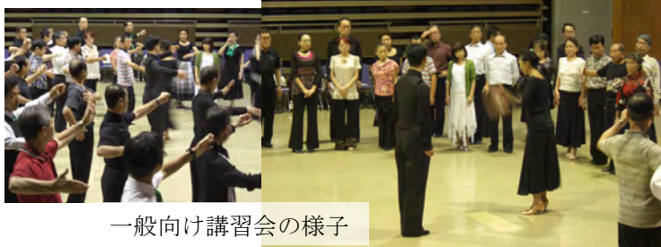
一般向け講習会の様子

9月23日(金)は小布施北斎ホールで競技選手及び一般ダンス愛好家向けの講習会が催されました。講師は元全日本アマチュアスタンダードチャンピオン、