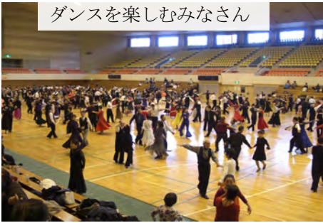
ダンスを楽しむみなさん

昨年 12 月 18 日(土)松本市総合体育館において年末ダンススポーツフェスティバルが開催されました。今年で 2 回目になるこの企画は、指導員紹介があり「県下指導員と踊ろう」と銘打って、松本市総合