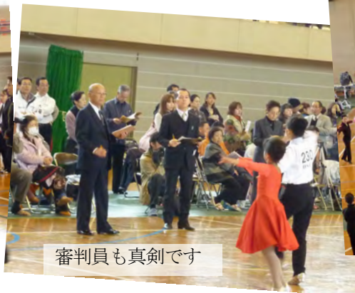
審判員も真剣です