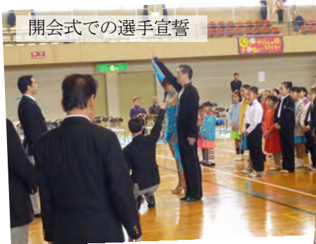
開会式での選手宣誓

平成22年11月14日(日)佐久市総合体育館において第30回長野県ダンススポーツ大会が開催されました。B級戦以下さまざまな区分にのべ430区分、254組の競技選手が日頃の練習の成果を披露しました。B, C, D, 1, 3, 5級戦に加えプレジュニア戦、ジュニア小学生以下戦、ジュニア中学生以下戦、女子同志のペアで踊る女子高校生以下戦、新人戦、グランドシニアB級戦の区分も設けられ熱戦が繰り広げられました。