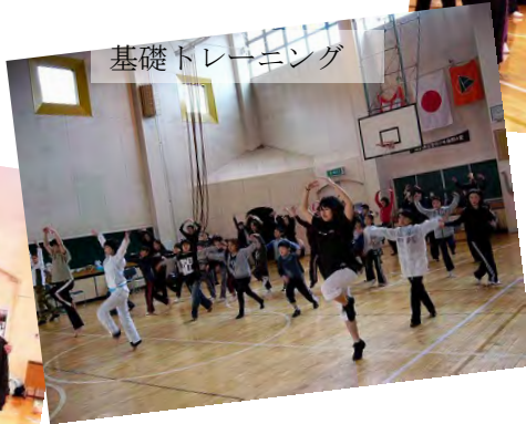
基礎トレーニング